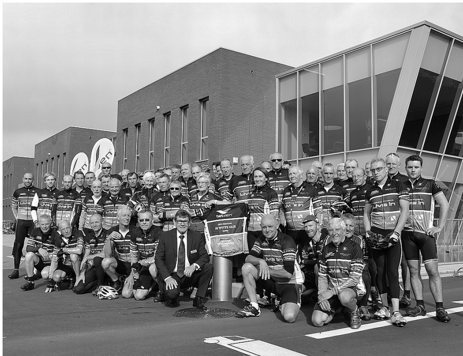
Bezoek van een aantal clubleden aan sponsor Belven tijdens de Open Bedrijvendag

Op de volgende pagina's vind je de kalenders met vertrektijden van de 4 ploegen. Je kan ze ook steeds raadplegen op wtwaarloos.be