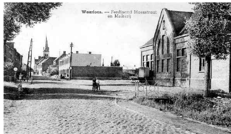
Uit Kontich Waarloos Hier en Nu, april 2009